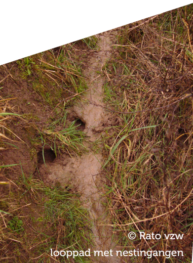
looppad met nestingen